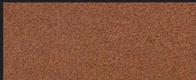
2912 Softerra braun