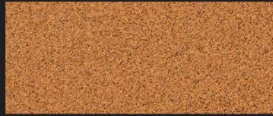
2911 Softerra natur