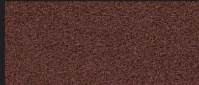
2914 Softerra tabak