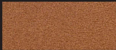
2915 Softerra cognac