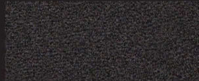
2913 Softerra schwarz