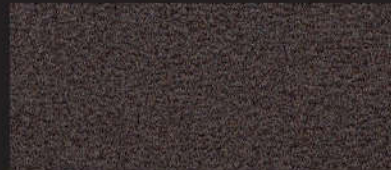
2916 Softerra dunkelbraun