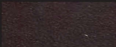
7014-15 dunkelbraun | 1,5 mm

7013 -15 | 1,5 mm -20 | 2,0 mm -25 | 2,5 mm -30 | 3,0 mm -35 | 3,5 mm