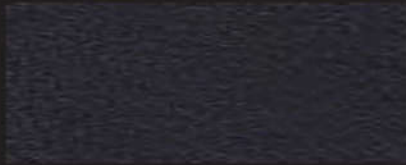
7011-15 schwarz | 1,5 mm

7010 -15 | 1,5 mm -20 | 2,0 mm -25 | 2,5 mm -30 | 3,0 mm -35 | 3,5 mm