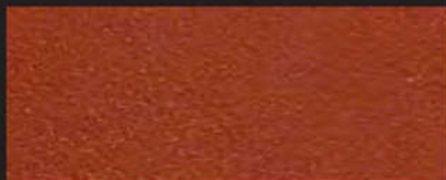
7013-15 cognac | 1,5 mm

7011 -15 | 1,5 mm -20 | 2,0 mm -25 | 2,5 mm -30 | 3,0 mm -35 | 3,5 mm