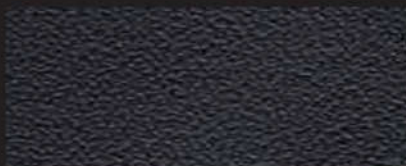
7041 schwarz/black | 2,5 mm