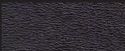
7004 schwarz /black | 2,0 mm färbt ab /rubs off