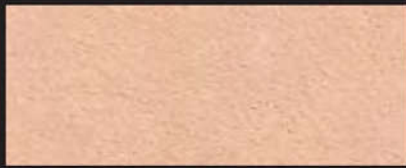
7010-15 natur | 1,5 mm

7010 -15 | 1,5 mm -20 | 2,0 mm -25 | 2,5 mm -30 | 3,0 mm -35 | 3,5 mm