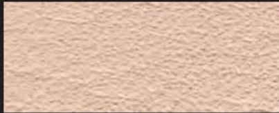
7003 natur | 1,8-2,0 mm